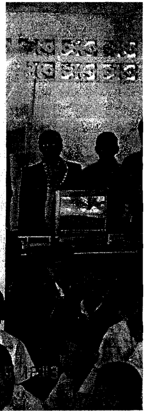
เวลา 15.00 นาฬิกา คณะเดินทางฯ ออกเดินทางกลับบ้านสบรวก ตำบลเวียง อำเภอเชียงแสน จังหวัดเชียงราย เพื่อศึกษาสภาพการพัฒนาเทคโนโลยีสารสนเทศและการสื่อสาร ตลอดจนสภาพการพัฒนาของสังคมและเศรษฐกิจโดยรวมของบ้านสบรวก